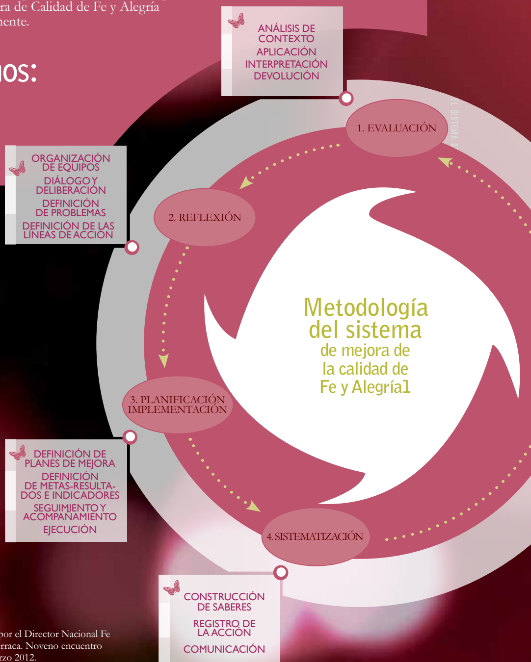
Gráfica 1 1